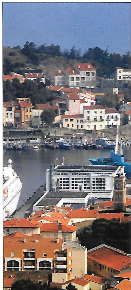
■ Le port de Port-Vendres ne demande qu'à exporter les productions locales.