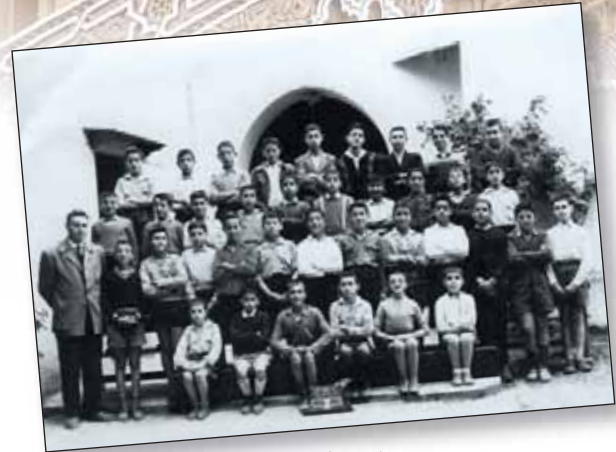
Fès (Maroc), 1957. La classe de Raphaël Bensimon, 37 élèves disciplinés.

À la fin des années 1940, l'Alliance crée 27 nouveaux établissements dans les endroits les plus reculés du Maroc, sous l'impulsion de Ruben Tajouri et d'Elias Harrus, à la tête d'une équipe de jeunes instituteurs motivés.