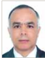
S.E Chakib Benmoussa

Des juifs originaires du Maroc se sont installés un peu partout dans le monde : à New York et Los Angeles, à Madrid et Barcelone, à Paris et Marseille, à Buenos Aires et à Montevideo, et même dans ces endroits lointains nommés Johannesburg, Melbourne, Hong-