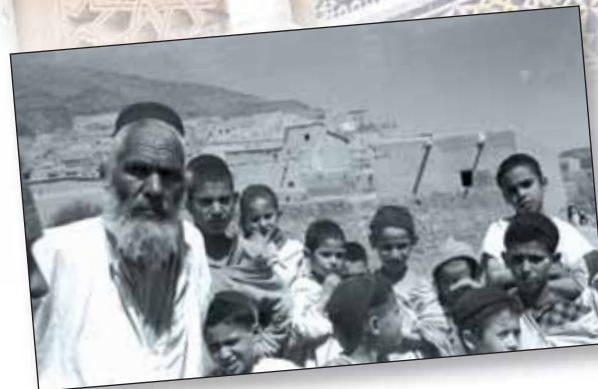
Maroc, 1952. Reportage d'Elias Harrus. Des élèves avec leur maître dans l'Atlas marocain. © Elias Harrus

C'est encore dans ce pays, qu'après 1945, des dizaines d'écoles vont être ouvertes dans de petites localités reculées, exemple unique dans l'histoire de l'Alliance. C'est dire toute la place qu'occupe ce pays dans l'histoire de l'institution qui n'a pu développer ce réseau que grâce à l'engagement et à la persévérance de maîtres dévoués tels que Y.D. Sémach, Ruben Tajouri ou Elias Harrus.