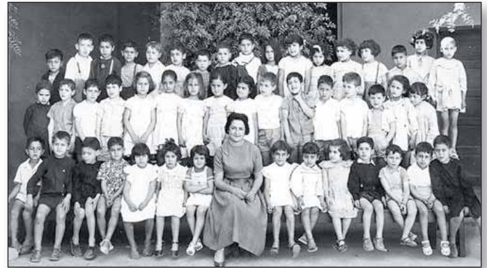
Ecole Georges et Maurice Leven, cours préparatoire, Marrakech (1950)