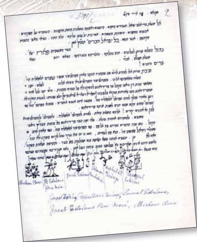
1910. Lettre en hébreu de rabbins de Meknès au comité central de l'Alliance. Les instituteurs doivent être nommés avec l'accord de la communauté juive.