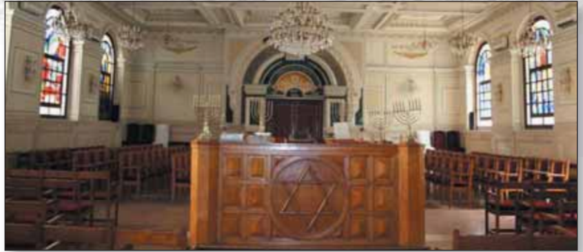
Synagogue Bet-El de Casablanca