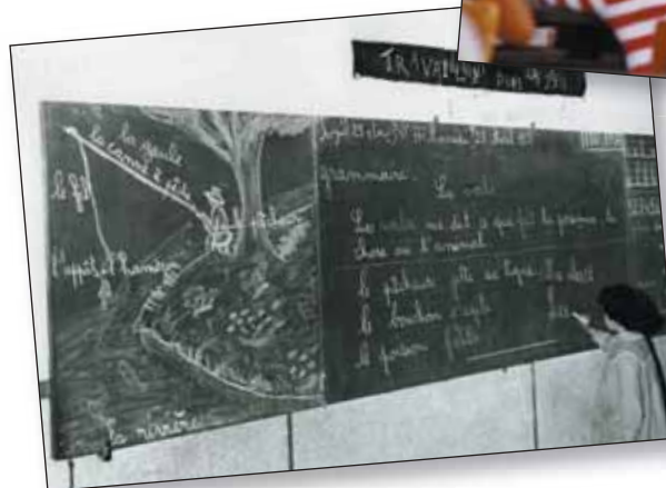
MAROC Casablanca, 1958 Ecole William Qualid. Cours de français. Une élève au tableau.

INSCRIPTION aux activités des Journées du Judaïsme marocain sur www.centrecomparis.com ou par courrier en précisant le nombre de places réservées et pour quelle activité, chèque à l'ordre de Centre Communautaire de Paris 119, rue La Fayette 75010 PARIS