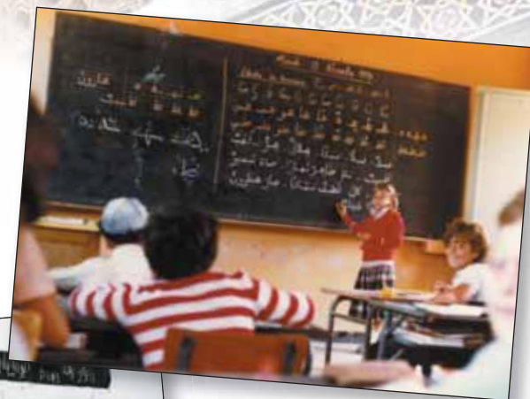
Casablanca, 1979. Cours d'arabe à l'école de l'Alliance.