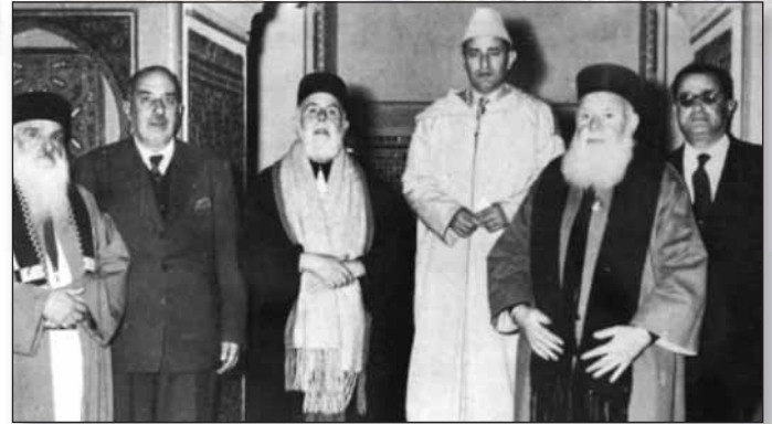
S.M. Mohammed V et les Rabbins du Maroc