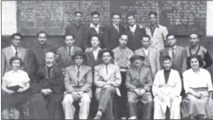
Classe d'hébreu au Maroc