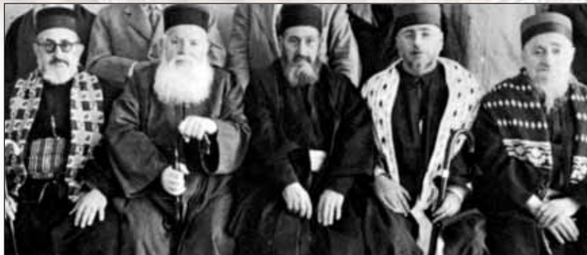
Les Rabbins du Beth Din du Maroc