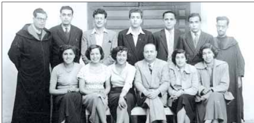
Les enseignants de l'École de l'AUI Y. Corcos, Marrakech (Maroc), 1950.