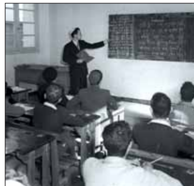
Casablanca, 1952. Cours de poésie juive médiévale à l'École normale hébraïque. Au tableau, un poème de Juda Halévi (1085-1141) qui commence par : « Mon cœur est en Orient alors que je suis en Occident ».