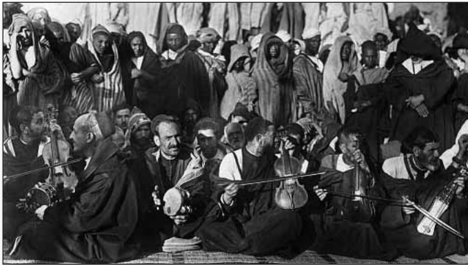
Groupe de musiciens juifs du Maroc