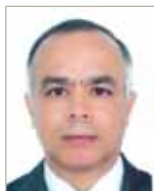
S.E Chakib Benmoussa