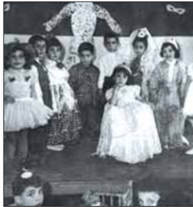
Déguisements pour Pourim