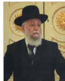
Grand Rabin Pinhas Obadia (fils)