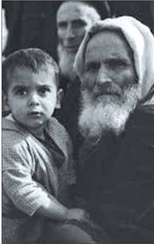
Famille juive du Maroc