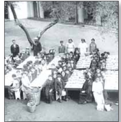
Œuvre de Nourriture et d'Habillement. Aide scolaire, Marrakech (Maroc), 1928