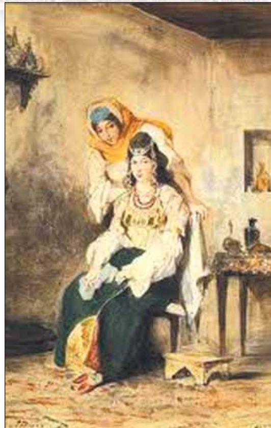
Préparation au mariage juif marocain