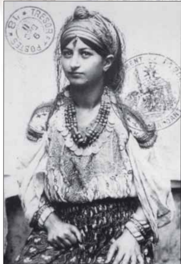
Femme de Debdou